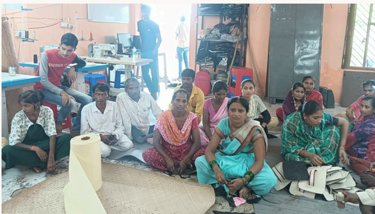
बैग बनाने के लिए लाभार्थियों का अभिमुखीकरण