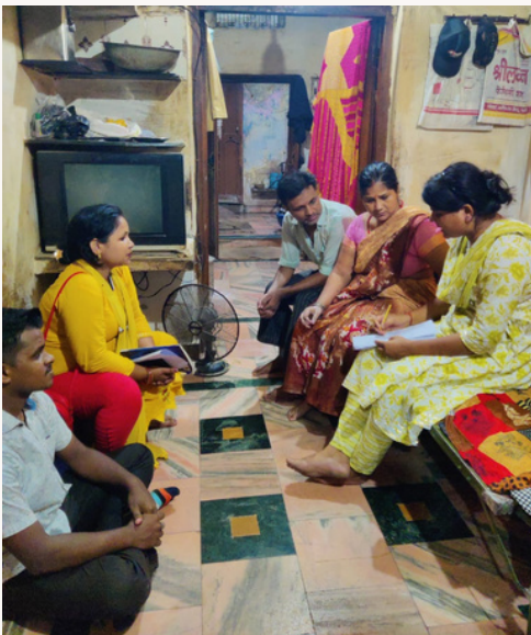
पूर्व व्यावसायिक प्रशिक्षण के लिए लामबंदी

गिफ्टएबल ने अपने नए बैच के प्री-वोकेशनल ट्रेनिंग के माध्यम से व्यक्तियों को सशक्त बनाने के लिए एक व्यापक दृष्टिकोण शुरू किया है। परिवहन चुनौतियों का समाधान करने के लिए, हमने एक ई-रिक्शा खरीदा, जिससे यह सुनिश्चित हुआ कि हमारे लाभार्थी बिना किसी कठिनाई के सत्रों में भाग ले सकें। हमने अपने लाभार्थियों के लिए एक ओरिएंटेशन सत्र आयोजित करके शुरुआत की, जिसमें बैग बनाने जैसे कौशल पर ध्यान केंद्रित किया गया। इसके अतिरिक्त, कंप्यूटर प्रशिक्षण का पहला बैच सफलतापूर्वक शुरू किया गया है, जिससे प्रतिभागियों को आवश्यक डिजिटल कौशल से लैस किया गया है। ये प्रयास अवसर पैदा करने और ज़रूरतमंद लोगों के लिए अनुरूप सहायता प्रदान करने की हमारी निरंतर प्रतिबद्धता का हिस्सा हैं।