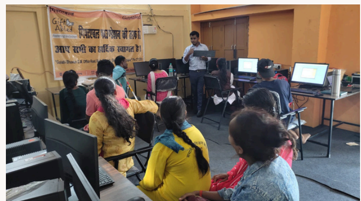
प्री वोकेशनल ट्रेनिंग बैच 1 के लिए कंप्यूटर प्रशिक्षण