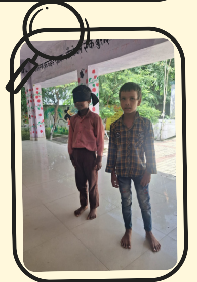
ब्लाइंड फोल्ड गेम