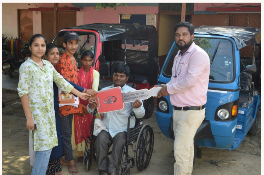
परिवहन समस्याओं के समाधान के लिए ई-रिक्शा खरीदा